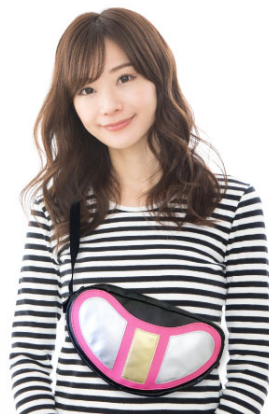
大関鞆工房製 マイクロカレントパッチ ショルダーバッグ